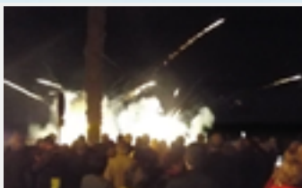
Feu Artifice 2018