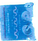
Signal national d'alerte

Les cloches de l'église sonneront le tocsin