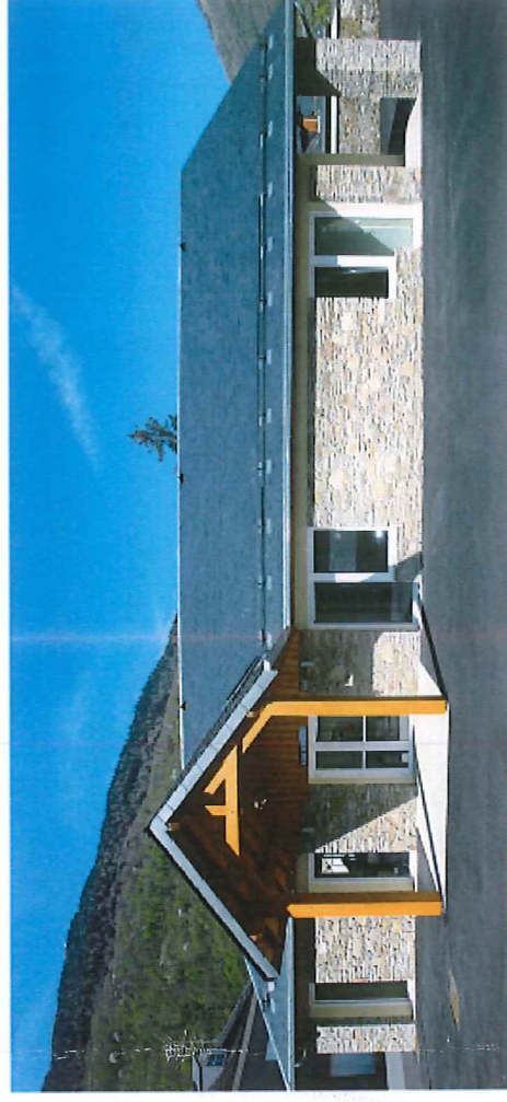
MAIRIE DE SAINT-MAMET